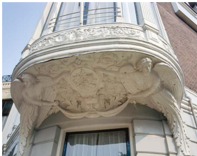
Den Haag, Surinamestraat 9, maker onbekend 1975, RCE.